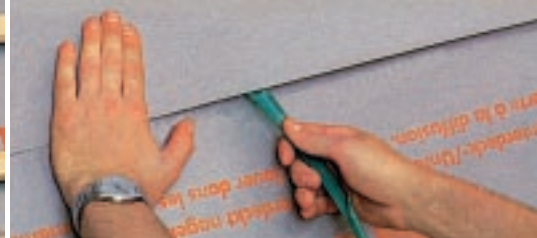
Wiatroszczelne układanie z DELTA®-VENT N PLUS.