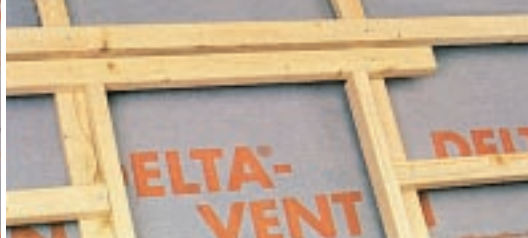
Detal przy wbudowywaniu okna.