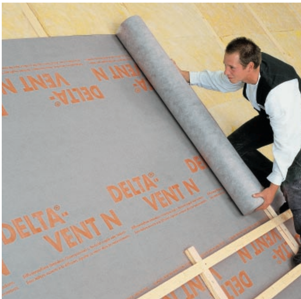
DELTA®-VENT N ma jako 3-warstwowa folia szczególne zalety przy układaniu.

DELTA®-VENT N PLUS ze zintegrowanym paskiem klejącym dla jeszcze wyższej oszczędności energii i szybkiego wiatroszczelnego układania.