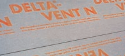
Napisy na produkcie oznaczają brzeg zakładek.