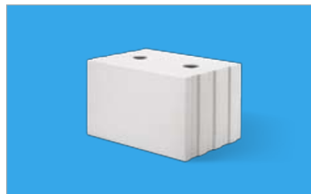
Blok pełny SILKA E-S profilowany na pióro i wpust