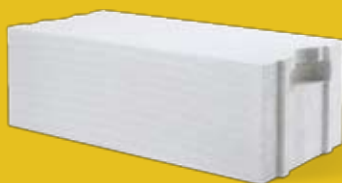
Błoczek YTONG S+GT profilowany na pióro i wpust z uchwytem montażowym