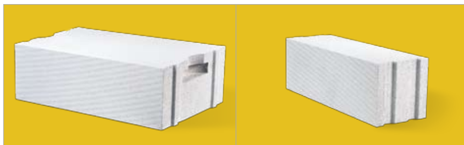
Bloczek YTONG S+GT profilowany na pióro i wpust z uchwytem montażowym