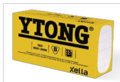
Pakiet bloczków YTONG