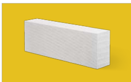
Bloczek YTONG gładki