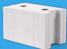
Blok drążony SILKA E profilowany na pióro i wpust z uchwytem montażowym