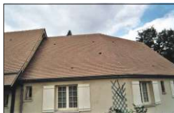
dach po oczyszczeniu środkiem DIMOUSSE