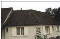
dachówka porośnięta mchem