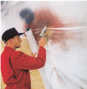
DELTA®-REFLEX - uniwersalna wiatro- i paroizolacja.